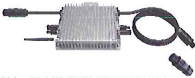
Abb. DEYE SUN-M600G3-EU