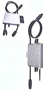
Abb. von oben: Hoymiles HM-300, DEYE SUN-M600 G3-EU 600 W mit WLAN, links zwei PV-Module mit 380 Wp